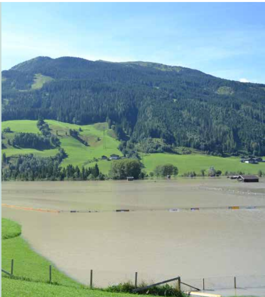
Irányított árvízvédelem a Salzach folyó mellett. Mittersill önkormányzata, 2014

A másik önkormányzat a mezőgazdasági földtulajdonosokat állami forrásból, valamint a mentesített, újonnan beépíthetővé vált területek értéknövekedésének bevételeiből kompenzálja. A kármegelőzés/csökkentés közvetlen hatását élvező eredeti ingatlanulajdonosok nem járhatnak hozzá az árvízvédelmi költségeik kompenzálásához.